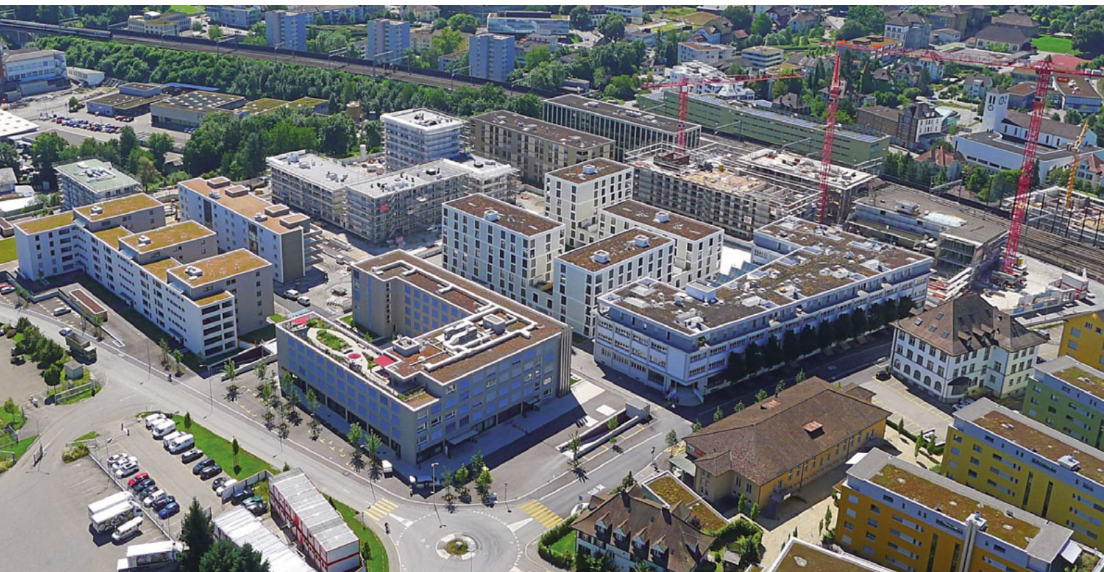
«Im Lenz», Juli 2016: Das neue nachhaltige Quartier von Lenzburg nimmt Gestalt an.