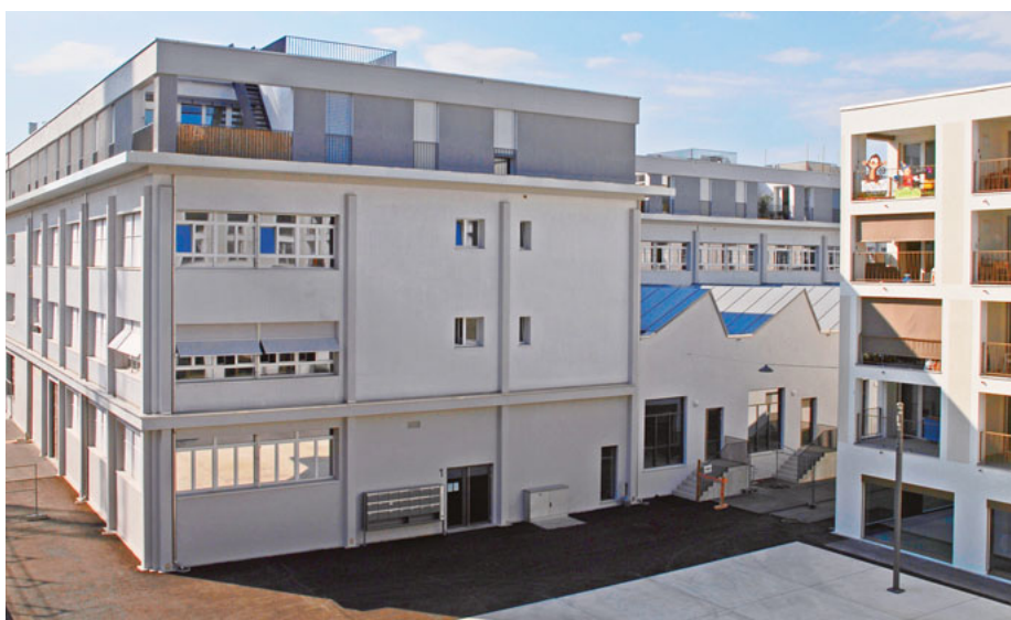
Einige Gebäude der ehemaligen Herofabrik wurden ins neue Konzept integriert. Damit bleibt auch die Geschichte des Areals erkennbar.

Text: Werner Aebi // Fotos: Losinger Marazzi, Werner Aebi